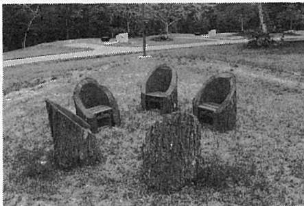
—道民の森 一番川地区オートキャンプ場—

オートキャンプ場内にいくつか設置されている、大径木のガッポを生かした椅子。荒削りだがよく自然にマッチしており、使用されている樹種はセン、イタヤ、ナラなど多彩である。