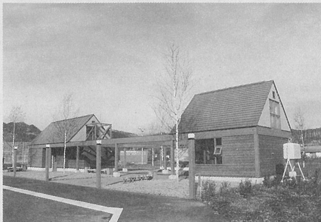
上川町 トイレ・休憩所複合施設

上川町の国道39号線沿いに、鮮やかな色彩とユーモラスな形で一際目を引く施設があります。この施設は、コンパクトにトイレ・休憩所・テラスなどがうまく組み合わされた複合施設となっており、木質材料がふんだんに使われています。ドライブの途中で疲れたら、木製デッキの上でのしばしの休憩はいかがでしょうか？