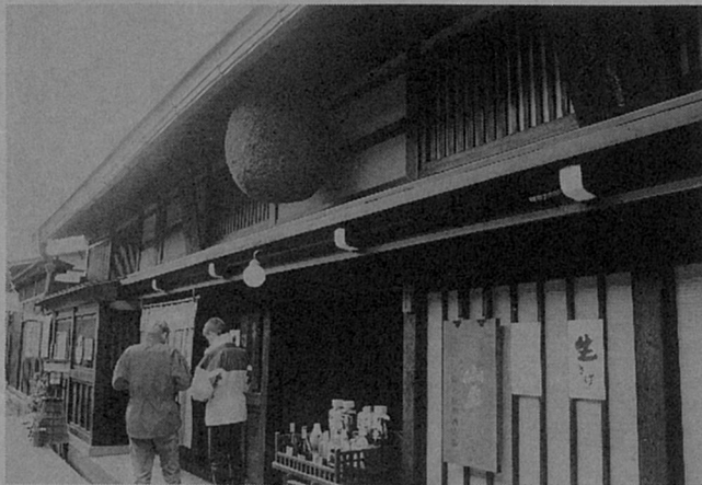
古き良き木を訪ねてシリーズ7 高山市 酒林（さかばやし）

飛騨高山には、8件の造り酒屋があり、いずれも三町筋にあつまっています。それらの造り酒屋の目印となるのが酒林です。