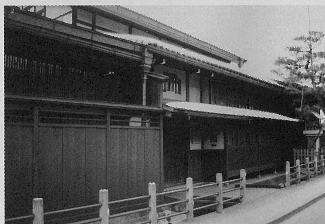
古き良き木を訪ねてシリーズ18 岐阜県高山市 上三之町

上三之町の特徴は、軒の揃った高さ、連なる出格子です。幾何学的な模様に見えるほどの精緻な連格子は、飛騨の伝統木工の技術力の高さを物語っています。この連格子が特徴の町並みには、小気味よいリズム感すら与えられた印象を受けます。