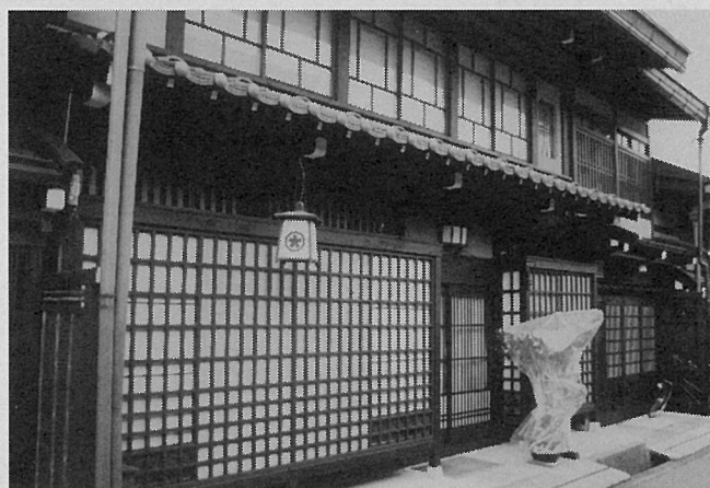
古き良き木を訪ねてシリーズ20 岐阜県高山市上三之町

上三之町では、規制されているのか派手な看板を見かけることはありません。この茶房も小さな行灯一つが吊るされているだけでした。