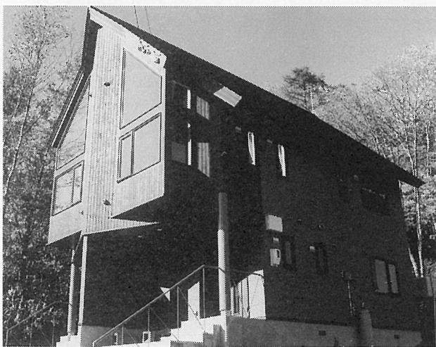
北海道虻田郡ニセコ町