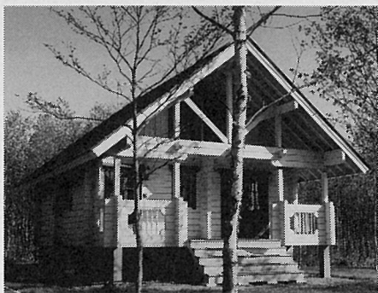
北海道虻田郡ニセコ町

マシンカットの角ログハウスからは、ハンドカットには無い、凛とした印象を受けます。周囲の白樺林に併せてコーディネートされた白い外壁が、周囲の景観に良く馴染んでいました。