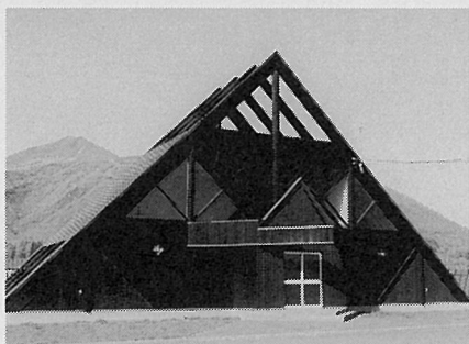
北海道虻田郡ニセコ町

表紙の写真は、観光、防災など多用途に使うことを目的とした、東山スキー場の近くにある、ヘリポートの管理棟です。