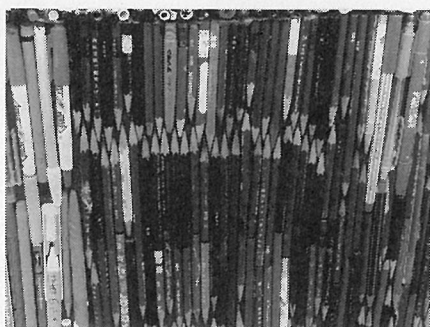
瀬戸会場 海上広場 オブジェ「知恵の門」

表紙の写真は、芸術家、林世宝さんが「ペンが剣(暴力)より強し」の信念に基づき、平和を願うシンボルとして製作した「知恵の門」です。