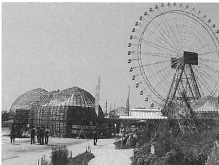
長久手会場 地球市民村パビリオン

地球市民村のパビリオンは、双子の卵型の竹ドームの竹の反力を利用してテント屋根を吊り上げる構造となっています。