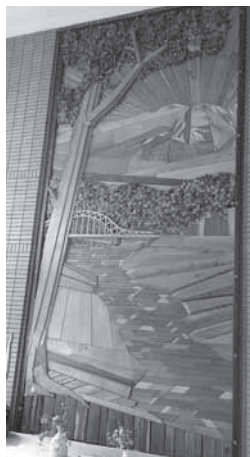
神楽市民交流センター 木製レリーフ 旭川市

交流センターのエントランスホールには、大雪山・石狩川を背景とした旭川市の様子が描かれた、巨大な木製レリーフが設置されています。