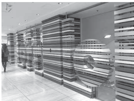
ロフト札幌ロフト店 札幌市

表紙の写真は、札幌駅前の大型商業施設に設置されている木製サインです。板材でストライプ状に「LOFT」の文字を作っています。様々な樹種の材色を活かした、暖かみのあるグラデーションがとても綺麗でした。