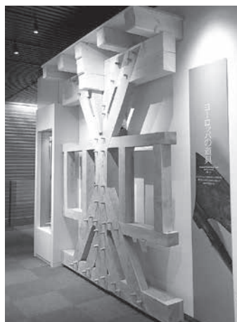
竹中大工道具館 ドイツ壁模型 神戸市

表紙の写真は、ヨーロッパの代表的な木造建築であるエスリンゲン市庁舎（1430年建立）で使用されているドイツ壁の模型。柱梁と腰貫に筋交を組み合わせた軸組を繰り返し、特徴的な意匠を創り出している。