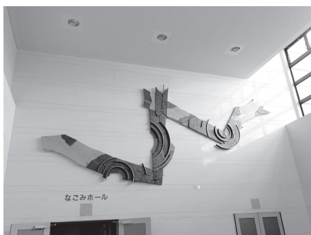
和寒町公民館 恵み野ホール レリーフ「風を感じて」 上川郡和寒町

恵み野ホールは、平成12年4月の開館以来、生涯学習や各種文化サークルの拠点として多くの和寒町民に親しまれている施設です。