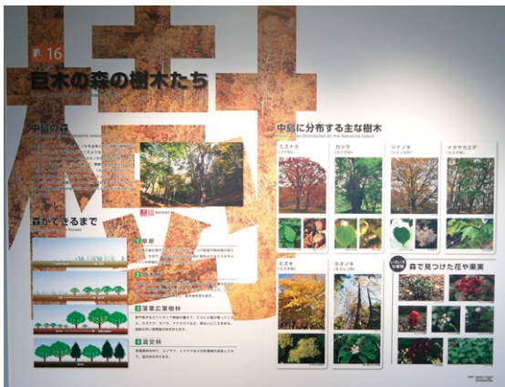
巨木の森の樹木たち