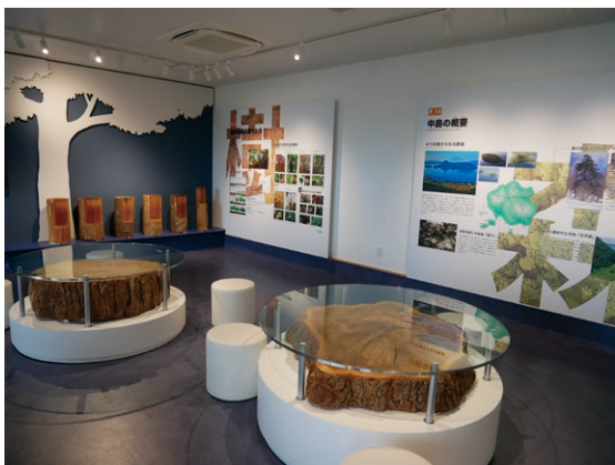
洞爺湖と中島の自然ゾーン