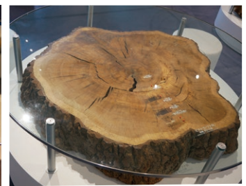
年輪テーブル ハリギリ(左) ミズナラ(右)