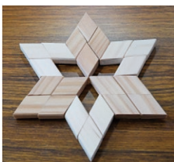
子どもたちの作品