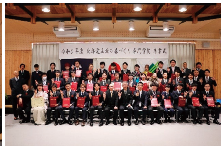
【卒業生の集合写真】