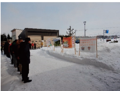
【林産試験場職員からのエール】

この度の無事の卒業に至り、全道各地の自治体や企業・関係団体のみなさまから短期就業体験実習や長期就業実践実習、地域見学実習の対応など多大なご支援とご協力をいただきました。この場をお借りして厚くお礼申し上げます。