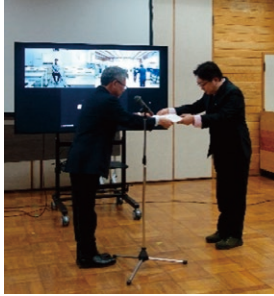
【総務部総務課主任】