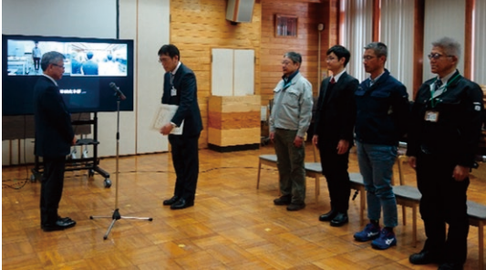
【木質粗飼料開発チーム】 講堂 5名, オンライン 1名参加

3月18日、7名（二組）の森林研究本部職員が令和5年度（地独）北海道立総合研究機構森林研究本部長表彰を受けました。一組目は、道内産業の振興・発展に貢献した「木質粗飼料開発チーム」の6名です。二組目は、道総研のコンプライアンスの確立に貢献した総務部総務課主任の1名です。