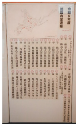
【内定掲示板の様子】

合同企業説明会には、昨年度の88企業から、4企業増えて、92社もの企業等の皆様に参加申込をいただき、北森カレッジの生徒への就業に対する期待の高さを感じています。