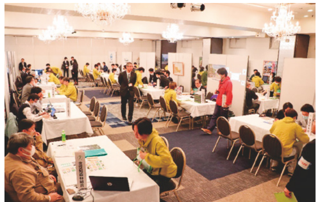
【昨年度の合同企業説明会の様子】